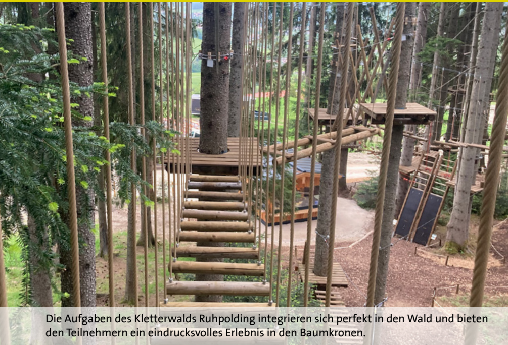
Die Aufgaben des Kletterwalds Ruhpolding integrieren sich perfekt in den Wald und bieten den Teilnehmern ein eindrucksvolles Erlebnis in den Baumkronen.