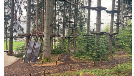
An der Talstation am Unternberg wartet auf 7.900 m² Kletterspaß für die ganze Familie.

„Mit unserer langjährigen Erfahrung in der Realisierung von Waldseilgärten freuen wir uns, am Unternberg wieder einen einzigartigen Waldseilgarten geschaffen zu haben, der Abenteuer und Selbsterfahrung in der Natur ermöglicht.“